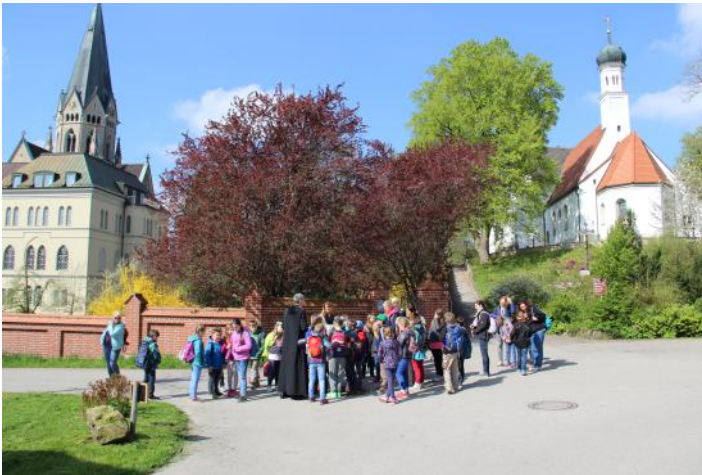
Bild: Gersthofer Kommunionkinder in St. Ottilien