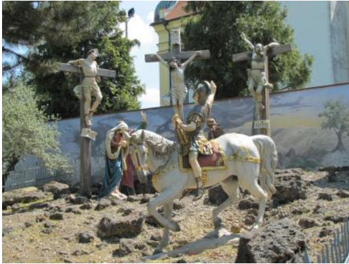
Bilder: Wallfahrtskirche in Biberbach (privat)

bach“ viele Wunder berichtet, wovon auch die vielen Votivgaben ein beredtes Zeugnis geben. Auch heute noch sind zahlreiche Wallfahrer, vor allem aus dem schwäbischen Raum, ein besonderes Zeichen der in-nigen Verbundenheit mit diesem Gnadenbild.